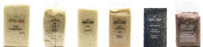
RISO CARNAROLI DI BRA RISO ARBORIO RISO BASMATI RISO INTEGRALE RIBE RISO NERO VENERE INTEGRALE RISO ROSSO INTEGRALE ERMES