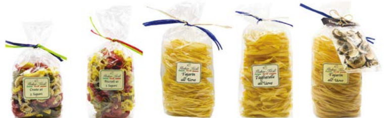
CRESTE AI 5 SAPORI