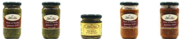
PESTO AL BASILICO GENOVESE DOP