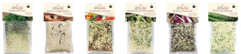
RISOTTO ALL'ORTICA RISOTTO AI FUNGHI PORCINI RISOTTO ALLA CONTADINA RISOTTO ALLE ZUCCHINE ITALIANE RISOTTO AL RADICCHIO RISOTTO AGLI ASPARAGI