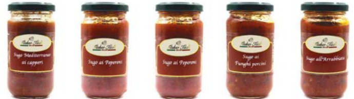
SUGO MEDITERRANEO AI CAPPERI