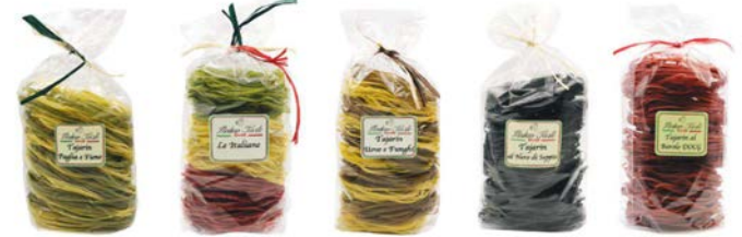
TAJARIN PAGLIA E FIEÑO