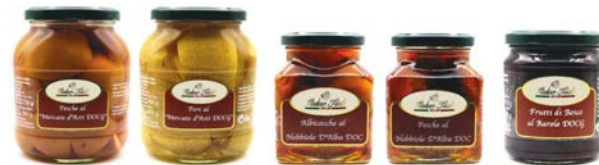
PESCHE AL MOSCATO D'ASTI DOCG PERE AL MOSCATO D'ASTI DOCG ALBICOCCHE AL NEBBIOLO D'ALBA DOC PESCHE AL NEBBIOLO D'ALBA DOC FRUTTI DI BOSCO AL BAROLO DOCG