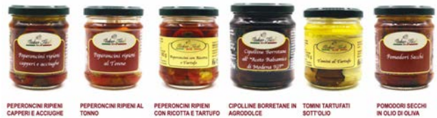
PEPERONCINI RIPIANI CAPPERI E ACCIUGHE PEPERONCINI RIPIANI AL TONNO PEPERONCINI RIPIANI CON RICOTTA E TARTUFO CIPOLLINE BORRETANE IN AGRODOLCE TOMINI TARTUFATI SOTTOFOLO POMODORI SECCHI IN OLIO DI OLIVA