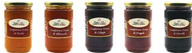
CONFETTURA EXTRA DI PESCHE CONFETTURA EXTRA DI ALBICOCCHE CONFETTURA EXTRA DI CILIEGIE CONFETTURA EXTRA DI FRAGOLE CONFETTURA EXTRA DI MIRTILLI